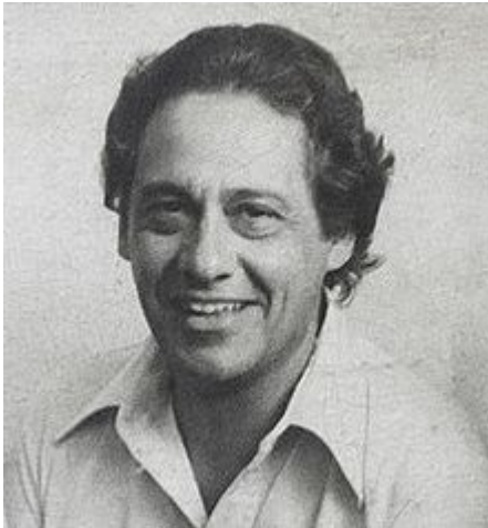
FH Cardoso, en la década de 1970