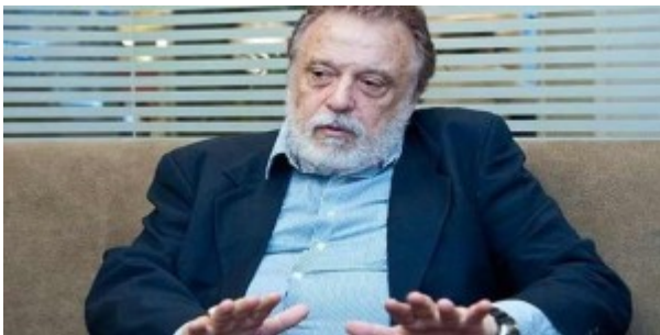
Theotonio dos Santos

También Dos Santos cuestionó la propuesta liberal de repetir el modelo estadounidense mediante la adopción de comportamientos modernizantes. Señaló que la inserción internacional de la región como exportadora de productos agro-mineros obstruía su desarrollo y refutó la falacia de una paulatina convergencia con las economías avanzadas (Dos Santos, 2003). Además, demostró la inconsistencia de todos los indicadores utilizados por los economistas neoclásicos para evaluar el pasaje de una sociedad tradicional a otra industrial (Sotelo, 2005).