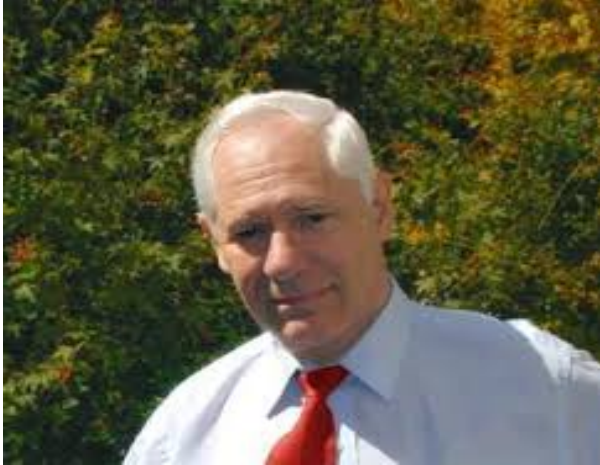
André Gunder Frank

Frank priorizó el análisis de los drenajes que sufre la periferia, en sintonía con los enfoques de polarización absoluta entre el centro y la periferia de la periferia. En cambio Marini, Dos Santos y Bamberger incorporaron un registro de las bifurcaciones existentes entre economías agro-exportadoras (Chile) y parcialmente industrializadas (Brasil).