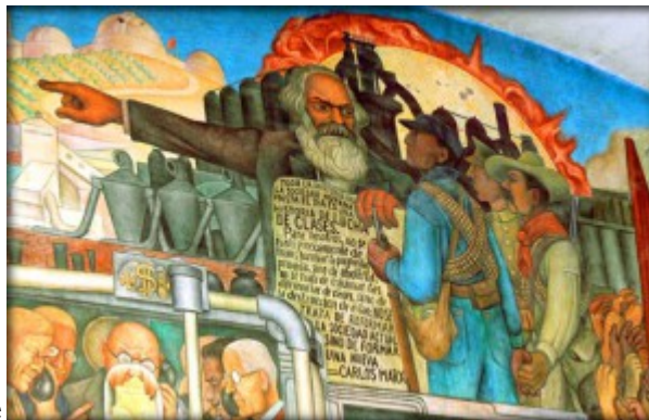
La visión metrópoli-satélite

Con estas caracterizaciones del status teórico de la dependencia, los tres marxistas brasileños completaron la presentación de un enfoque que trastocó la agenda de las ciencias sociales latinoamericanas. Los conceptos introducidos por Marini, las caracterizaciones políticas de Dos Santos y las miradas de Bamberger sobre el subdesarrollo desigual crearon perdurables referencias analíticas para los pensadores de ese período.