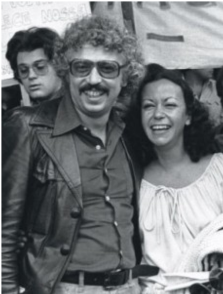
Theotonio dos Santos y Vania Bambirra vuelven del exilio (1979)

Marini, Dos Santos y Bambirra postularon conceptos acordes a esa esperanza. Participaron en organizaciones que luchaban contra las dictaduras militares y alentaban proyectos de izquierda, en el turbulento período comprendido entre el ascenso de la Unidad Popular chilena (1970) y la caída del Sandinismo (1990).